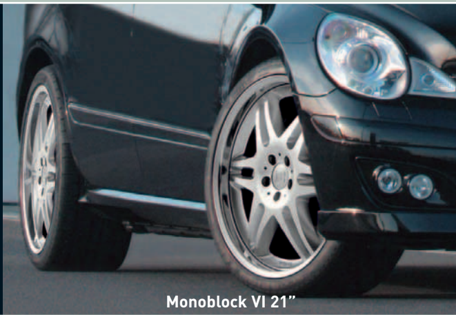
Monoblock VI 21"