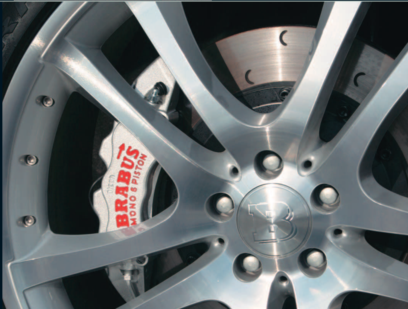
BRABUS Monoblock VI

Doppel-Speichendesign, silber ganz poliert