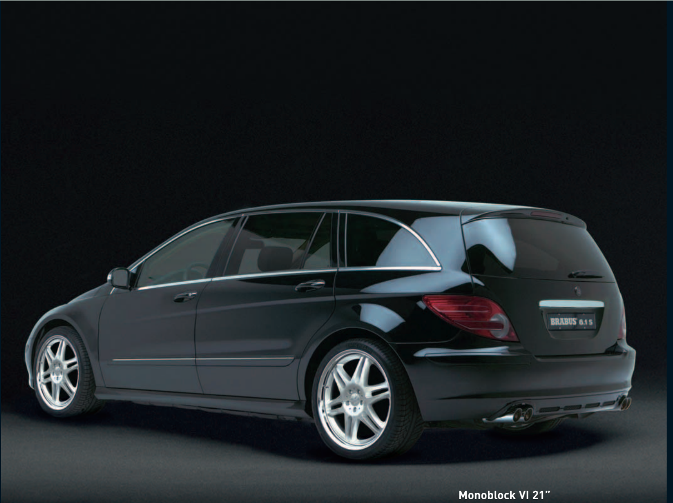
Monoblock VI 21"

For a more sporty emphasis of the characteristic R-Class lines the BRABUS designers have developed an elegant aerodynamic-enhancement kit, manufactured from Pur-r-Rim in OEM quality.